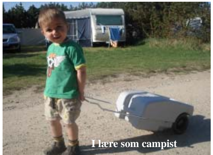
I lære som campist